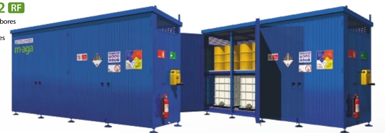
T32 RF 32 Tambores 8 IBC 2 Niveles