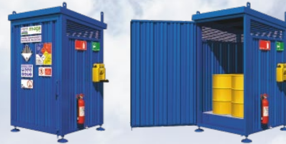
T8 8 Tambores 2 IBC