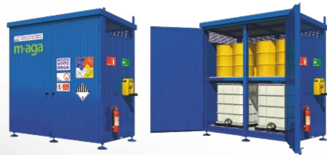
T24 RF 24 Tambores 6 IBC 2 Niveles