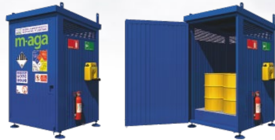
T8 RF 8 Tambores 2 IBC