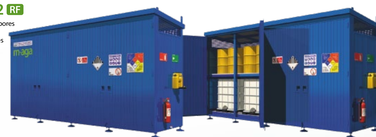
T32 RF 32 Tambores 8 IBC 2 Niveles