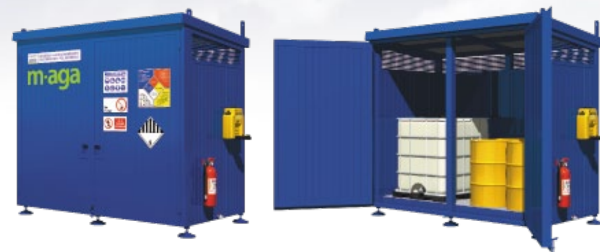
T12 RF 12 Tambores 3 IBC