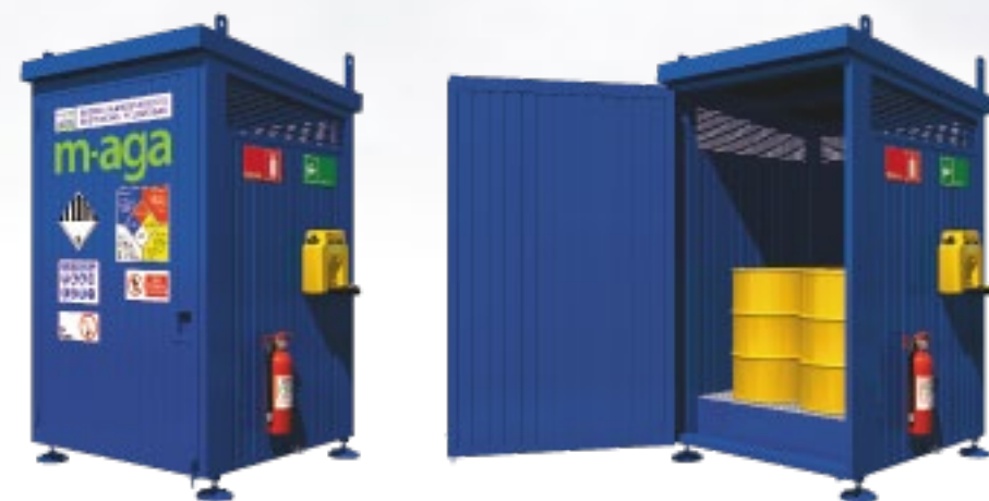
T8 RF 8 Tambores 2 IBC