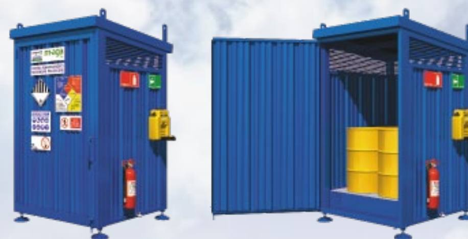
T8 8 Tambores 2 IBC